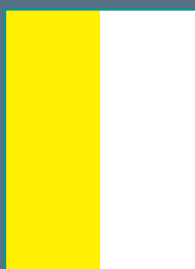
1/2 PAGINA VERTICALE al vivo cm 10,2 x 28 + 5 mm di rifilo