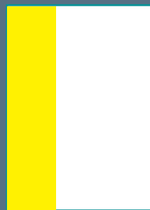
1/3 PAGINA VERTICALE al vivo cm 7 x 28 + 5 mm di rifilo