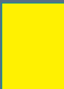
PAGINA INTERA al vivo cm 21 x 28 + 5 mm di rifilo