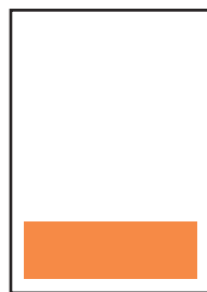
1/4 PAGINA ORIZZONTALE cm 18 X 6